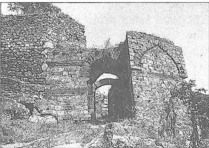
XV. yüzyılda Osmanlılar tarafından yeniden inşa edilen şehir kalesinin batı kapısı - Dimetoka

Dimetoka'nın Osmanlı dönemindeki durumu hakkında ilk bilgi, 1433'te burayı iki defa ziyaret eden Bertrandon de la Broquière tarafından verilmektedir. Ona göre Dimetoka güzel bir kaleye sahip iyi bir kasaba hüviyetini taşıyordu ve burada yaklaşık 400 kadar ev bulunuyordu. İkinci gelişi sırasında şehri "Dimotiq" adıyla zikreden Broquière burayı ilk gelişinden daha iyi bulduğunu, padişahın hazinelerini burada sakladığını ve burayı muhafaza ettiğini de belirtir. Bu yüzyılda şehirde bazı eserler de inşa edildi. XV. yüzyıla ait olup kaynaklarda adı geçen eserler arasında II. Murad'ın adamlarından Kutluca Bey Mescidi, II. Bayezid'in veziri Karagöz Bey (sonra paşa) Mahallesi Mescidi, Karagöz Paşa Medresesi ve Nasuh Bey Camii, imareti, zâviyesi ve hanı sayılabilir. Ancak bu eserlerden hiçbirisi günümüze kadar gelmemiştir. Silistre ve İskenderiye sancak beyliklerinde bulunan Nasuh Bey II. Bayezid'in kızı Şah Hatun'la evlenmiş ve 910'da (1504-1505) kendilerine Beyköy temlik edilmişti. Bunların bu köyde bir camii ve bir de sıbyan mektebi mevcuttu. 1327 (1909) tarihli Edirne Vilâyeti Salnâmesi Nasuhbey köyünde Kara Baba Tekkesi'nden de bahsetmektedir ki bu tekke Nasuh Bey vakfına sonradan ilâve edilmiş olmalıdır.