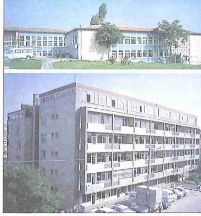
Diyanet İşleri Başkanlığı hizmet binaları - Kocatepe / Ankara

1960 İhtilâli'nden sonra yapılan 1961 anayasası, Diyanet İşleri Başkanlığı'nın genel idare içindeki yerini aynen muhafaza ederek özel kanunda gösterilen görevleri yerine getireceği hususunu ifade etmiştir. 22 Haziran 1965 tarih ve 633 sayılı Diyanet İşleri Başkanlığı Kuruluş ve Görevleri Hakkında Kanun ile, daha önceki on üç kanunda dağınık halde bulunan hükümler yürürlükten kaldırılarak başkanlıkla ilgili mevzuat tek metinde toplanmış, yeni görevler ve yeni birimler ilâve edilerek teşkilât geliştirilmiş ve günün şartlarına göre daha geniş bir hizmet imkânı sağlanmıştır. Bu kanunun ihtiva ettiği önemli yenilikler, bütün görevler için belli nitelik ve tahsil şartı getirilmesi, Müşavere ve Dinî Eserleri İnceleme Kurulu yerine başkanlığın en yüksek karar ve danışma organı olarak üyeleri seçimle belirlenip bakanlar kurulu kararıyla tayin edilen Din İşleri Yüksek Kurulu'nun teşkili, Teftiş Kurulu, Hukuk Müşavirliği, Dinî Hizmetler ve Din