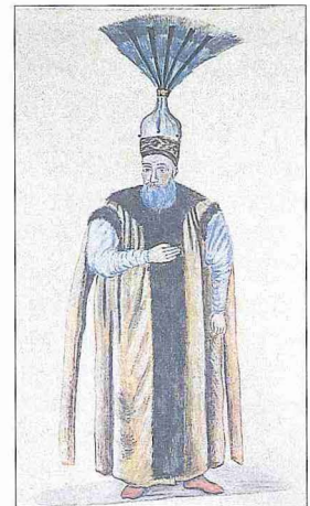
Doğancıbaşını resmî kıyafetleriyle gösteren bir resim (Türkische Gewänder und Osmanische Gesellschaft, İstanbul 1966, levha 39)

Doğancıbaşının yevmiyesi XVI. yüzyılda 20 akçe idi. Rikâbdar ağa kadar yıllık ödeneği vardı, ayrıca kandil ve bayramlarda kendisine bahşış verilirdi; yeme, içme ve giyim masrafları da saraya aitti. Padişahla birlikte çıktığı avlarda her av getirişte yine bahşış alırdı. Bayram tebriklerinde doğancıbaşı padişahın elini atmamacıbaşından sonra öperdi. Doğancıbaşı terfi ederse saray içinde şahincibaşı, çakırcıbaşı (Selânikî, I, 286; II, 441), mîrâhur olur, dış hizmete ise ye-