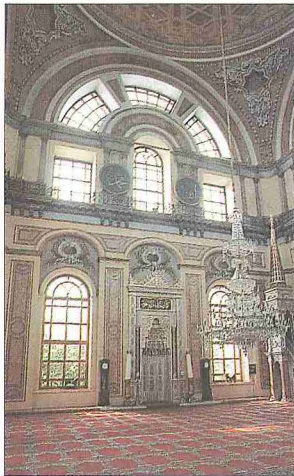
Dolmabahçe Camii ve içinden bir görünüş - İstanbul