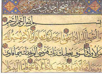
Duhâ sūresinin muhakkak hattıyla yazılmış ilk âyetleri

Duhâ süresi, İslâm güneşinin yükselişini sembolize eden kuşluk vaktiyle küfür ve şirk döneminin, bitmeye yüz tutmuş karanlık bir geceyi andıran haline yeminle başlar. Allah'ın Hz. Peygamber'i terketmediği ve kendisine darılmadığı bildirilir. Hz. Peygamber'i yakın bir gelecekte büyük başarıların beklediği, peygamberlik görevinin sonunun başlangıcından daha hayırlı olacağı müjdelendir. Aslında Hz. Peygamber annesiz babasız