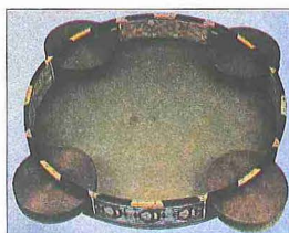
Dört zilli def (Sadberk Hanım Müzesi, Teşhir, nr. 9444, A. 31)

Sanat müzikisinde kullanılan def ortalama 30-40 cm. çapındadır ve kasnağının çevresinde muntazam aralıklarla yerleştirilmiş 8-9 cm. çapında beş çift zil bulunur. Deriye vurmak suretiyle elde edilen "düm" sesine karşılık ziller "tek" sesini verirler. Kasnak genellikle 3-4 cm. eninde olup beyaz çam, ceviz, kavak, gürgen gibi ağaçlardan yapılır ve değişik tekniklerde çeşitli bezemelerle süslenir. Çok ince olması gereken def derisi için balık derisi veya siğir mesânesi tercih edilir; ancak oğlak derisi de kullanılmaktadır. Ziller pirinç veya daha çok bafondan yapılır. Bazan bu standart tip deften başka küçük zillerin çerçevelediği 20-25 cm. çapında daha küçük deflere de rastlanmaktadır. Def, şeklinden dolayı dâire adıyla da anılmaktadır ve def çalana dâirezen denir. XIX. yüzyılda servi ağacından yapılmış ceviz kaplama, üzeri sedef ve gümüş kakma-