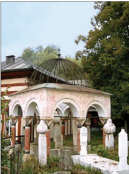
Muhsinzâde Abdullah Paşa'nın türbesi

Abdullah Paşa'nın sadrazamlığı döneminin en önemli dış hadisesi 4 Eylül 1746 tarihinde İran'da Nâdir Şah'ın öldürülmesinin ardından yerine geçen Avşar hânedanıyla yapılan, antlaşmanın devamını sağlamaya yönelik faaliyetler oldu. Nitekim I. Mahmud'un yazılı emri üzerine