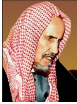
Abdülazîz b. Bâz

22 Kasım 1912 tarihinde Riyad'da doğdu. Ziraat, ticaret ve ilimle uğraşan, bazı mensupları kadılık yapmış olan bir aileye mensuptur. Ailenin Necid bölgesine Medine'den geldiği söylenmişse de kendisi aslen Riyad bölgesinden olduklarını belirtir. Üç yaşında iken babası vefat edince annesinin himayesinde yetişti. Kur'ân-ı Kerîm'i ezberledi. On altı yaşında gözlelerinden hastalandı ve yirmi yaşına gelmeden görme duyusunu tamamen kaybetti. İlim tahsilinde özellikle Muhammed b. Abdülvehhâb'ın soyundan gelen üç âlimden faydalandı. Bunların en önemlisi ve üzerinde en çok etki bırakanı, 1928-1938 yılları arasında derslerini takip ettiği Suudi