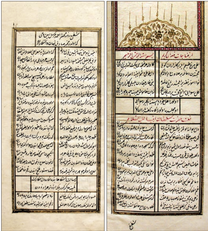
ÂĠâh divanının ilk iki sayfası (TSMK, Hazine, nr. 968)