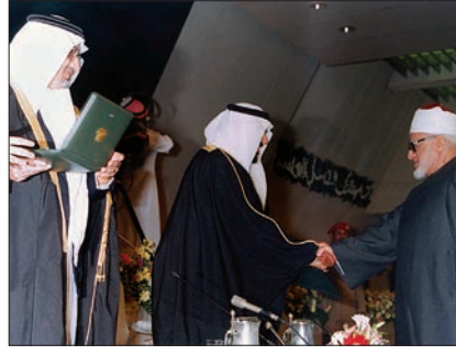
Câdelhak Ali Câdelhak Uluslararası Kral Faysal İslâm'a Hizmet ödülünü alırken (1995)

Ezher âlimlerinin ilmi bağımsızlığı ve haklarını savunma konusunda önemli adımlar atan Câdelhak, âlimlerin aşırı gruplara katılan ve İslâm'ı yanlış anlayan gençlerle diyaloga girmesinin gerekliliği üzerinde durmuştur. Enver Sedat ve Hüsnü Mübârek dönemlerinde Mısır'ın yaşadığı sosyal ve siyasal problemlerle ilgilenmiş, orta bir yol izlemeye çalışmıştır. Mısır'da ortaya çıkan cihad ve tekfir gruplarına karşı eserler kaleme almıştır. Mısır-İsrail arasında yapılan barışın fıkıh yönünden câiz olduğu yönünde fetva vermiş, ancak İsrail'in barış anlaşmasından sonraki tutumundan dolayı meseleye bakışı değişerek işgal altında iken Kudüs'ü ziyaret etmenin câiz olmadığı yönünde görüş ortaya koymuştur. Mısır'a gelen İsrail cumhurbaşkanını karşılamayı reddederek siyasî bir krize sebep olan Câdelhak, Sovyet işgali altındaki Afganistan'a yardım edilmesini teşvik etmiş, Bosna katliamına karşı sert açıklamalarda bulunmuş, Bosna'ya özel temsilcisini gönderip yardım konusunda öncülük yapmıştır. Çeçenistan gibi dünyanın değişik bölgelerinde bulunan müslüman azınlıklara yardım konusunda önemli adımlar atmıştır. Ayrıca dönemin cumhurbaşkanının taleplerine karşı çıkarak banka faizinin haram olduğu yönünde fetva vermiştir. Hayatının sonlarına