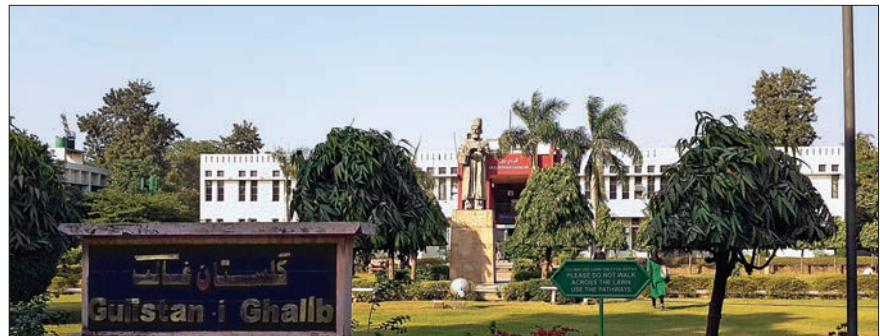
Câmia Milliye İslâmiye'nin kampüsü - Delhi/Hindistan

Üniversitenin kuruluşundan sonra Aligarh Koleji'nden bazı hocalar buraya geçerken bazıları da her iki yerde ders verdi. Aligarh Koleji öğrencilerinden bir grup Câmia Milliye'ye kayıt yaptırdı. Bu yeni kuruluş imkânsızlıklar sebebiyle ancak kiralanan evlerde, çadırlarda ve açık alanlarda eğitim yapabiliyordu. Muhammed Ali Cevher bu sırada Muhammed İkbâl'in Esrâr-ı Hôdî ve Rumûz-i bi-Hôdî adlı şiir kitaplarını, Hamîdüddin Ferâhî de Fâtiha sûresinin tefsirini okutuyordu. Dil, tarih