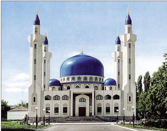
Maykop Merkez Camii – Adigey Cumhuriyeti

Ortaçağ'da güzellik, cesaret ve savaşçı yetenekleriyle bilinen Çerkezler Abbâsî, Eyyübî, Memlûk sarayları ve ordularında önemli rol oynadılar. Şah I. Tahmasb'dan itibaren Safevî sarayı ve ordusunda Gürcüler ve Ermeniler'le birlikte etkili oldular. Sultan Berkuk'tan (1382) devletin yıkılmasına kadar (1517) Memlûk sultanları Burcî denilen Çerkezler'di. Mısır'da Memlûk beylerinin siyasî, askerî, iktisadî etkinlikleri XIX. yüzyıla kadar sürdü. İlk Çerkez gazetesi İttihad 1899'da Türkçe olarak Kahire'de yayımlandı. XV. yüzyılda Osmanlı sarayı ve ordusuna girmeye başlayan Çerkezler, XVIII. yüzyıldan Osmanlı Devleti'nin sonuna kadar Harem ve Enderun'daki en kalabalık unsurdur. Osmanlı tarihinde on bir padişah annesi ve vâlide sultan, sekiz sadrazam, birçok vezir, asker, bürokrat ve saray görevlisi Çerkez'di. Mısır'da ve Kafkasya'daki Osmanlı kalelerinde Çerâkise Bölüğü denilen tamamı Çerkezler'den oluşan birlikler vardı.