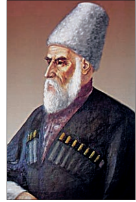
XVIII. yüzyılın ilk yarısında Çerkezler'in Müslümanlığa girişini sağlayan Kazanoko Jabağ'ı tasvir eden yağlı boya tablo

okutulan kitapları İstanbul'dan gönderilen kırk mektep vardı. Din bilginleri sayesinde XVIII. yüzyılda ve XIX. yüzyılın başlarında Çerkezler arasında Türkçe bilenlerin sayısı arttı. Halk tahılın % 10'unu, otuz büyükbaş hayvanın ya da kırk küçükbaş hayvanın birini, balın % 1'ini ibadet, eğitim ve cenaze hizmetlerine karşılık din görevlilerine veriyordu. Kuzey Kafkasya'ya Nakşibendîlik 1780'lerde, Kâdirîlik 1850'lerde ulaştı. Ancak tasavvuf ve tarikatlar feodal yapıdaki Çerkezler arasında çok etkili olmadı. Sovyet Sosyalist Cumhuriyetleri Birliği döneminde dinî ibadet ve eğitim yasaklandı. Dinî yapılar yıktırıldı. 1990'lardan sonra yeni camiler inşa edildi. Günümüzde küçük bir grup Ortodoks Kabarday ve 2000-3000 Katolik Kabarday dışında bütün Çerkezler Sünnî-Hanefî müslümanlardır.