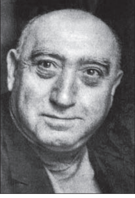
Fazıl Hüsnü Dağlarca

çıkarmıştır (Ocak 1960 – Temmuz 1964). Son günlerine kadar âdeta bir alışkanlık halinde kolayca şiir yazmayı sürdüren Fazıl Hüsnü'nün şiir kitaplarının sayısı yetmişi bulur.