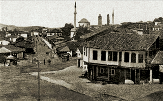
XX. yüzyıl başlarında Debre'yi gösteren bir fotoğraf

Kocacık, Noaci ve Pralenik köylerinde yaşamaktaydı. 1892'de Debre sancağında kırk dokuz cami ve mescid, kırk üç mektep, bir rüşdiye, yedi medrese, otuz dört tekke, 425 dükkân, yirmi yedi han, iki hammam ve 368 su değirmeninin bulunduğu belirtilmektedir. Bölgedeki dinî hayata dair doğrudan bir kayda rastlanmamaktadır. Halvetiye'nin Ramazâniyye şubesinden Hayâtiyye koluna mensup pek çok derviş olduğu, bunun yanı sıra Bektaşî ve Rifâîler'in de bulunduğu tahmin edilebilir. Aynı sene içerisinde Şemseddin Sâmî Bey ve Spiridon Gopçević birbirinden bağımsız olarak o yıllarda Debre'de 12.000 kişilik bir nüfusun yaşadığını yazmıştı. Kânčov'un 1900 yılına ait ayrıntılı listeleri, Debre şehri ve Debre kazasına bağlı kırk bir köyün 1912 sonrasında çizilen sınırları içinde kalan (bugün Makedonya'da yer alan eski Debre kazası) 31.373 nüfusun varlığını göstermektedir. Bunların 12.525'i Arnavutça konuşan müslümanlar, 3380'i Türkler ve 2662'si Bulgarca / Makedonca konuşan müslümanlardan (Pomaklar) meydana geliyordu. Hıristiyan nüfusu 12.306'ya yükselmışti. 500 müslüman Çingene dahil bölge nüfusunun % 61'inin müslüman, % 39'unun ise hıristiyan olduğu görülmektedir.