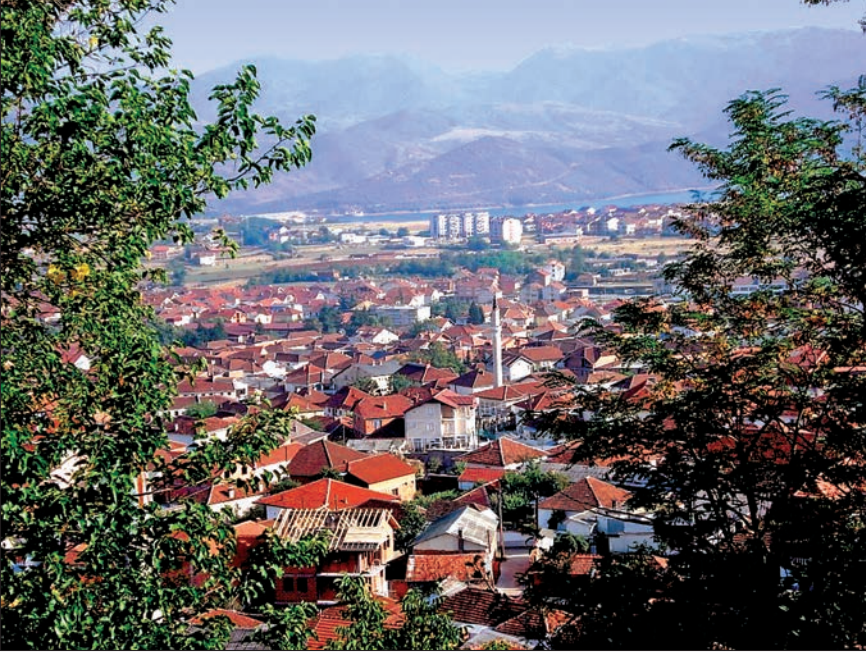
Debre'den bir görünüş

anılan bir mahalle oluştu. Ardından Bayram Bey, Debre'nin ikinci camisini inşa ettirdi. Çarşı bu iki uç arasında gelişti. Debre ismi aynı zamanda bölgelerin ismi olarak da söylenmeye devam etti (Yukarı ve Aşağı Debre).