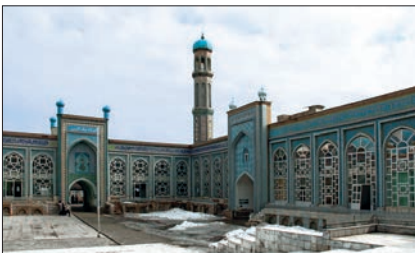
Ya'küb-i Çerhî Camii ve Medresesi'nin iç avlusu