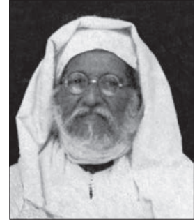
Ebû Abdullah ed-Dükkâlî