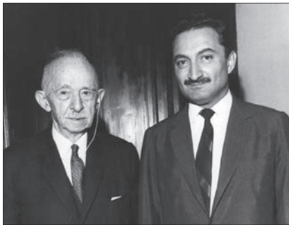
Bülent Ecevit İsmet İnönü ile birlikte

Efgânî'nin telif eseri bulunmamakla beraber Lecnetü ihyâ'î-maârifî'n-nu'mâniyye'de yirmiyeye yakın kitabın tenkitli neşrini gerçekleştirmiştir. Bizzat yayımladığı ve yayımına katkıda bulunduğu bu eserler şunlardır: Ebû Hanîfe, el-Âlim ve'l-müte'allim (Haydarâbâd 1349/1930); Ebû Yûsuf, Kitâbü'l-Âşâr (Kahire 1355/1936), er-Red 'alâ Siyeri'l-Evzâ'i (Kahire 1357/1938), İhtilâfû Ebi Hanîfe ve İbn Ebî Leylâ (Kahire 1357/1938); Muhammed b. Hasan eş-Şeybânî, el-Câmi'u'l-kebir (Kahire 1356/1937), Cüz' mine'l-Emâli ( el-Keysâniyyât , Ebü'l-Vefâ el-Efgânî v.dğr., Haydarâbâd 1360/1941; Şuayb b. Süleyman el-Keysânî'nin Şeybânî'den imlâ yoluyla yazdığı eserdir), Kitâbü'l-Aşl (el-Mebsût) (I-IV, Haydarâbâd 1386-1394/1966-1974; Lahor 1981; Beyrut 1410/1990; bu neşir eserin yaklaşık dörtte birine tekabül eder; sonraki bazı ticarî baskılarda eser beş cilt halinde basılmış ve Şefik Şehâte