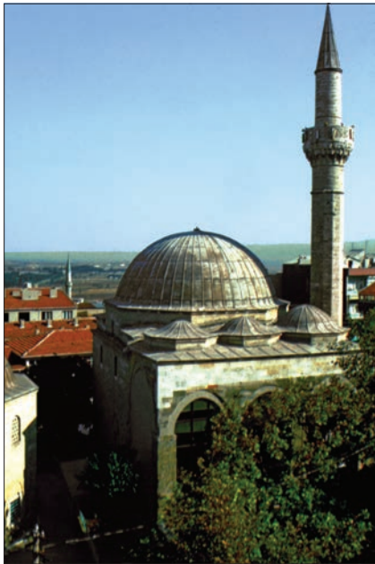
Gazi Ömer Bey Camii – Malkara / Tekirdağ

Gaznevî'nin günümüze ulaşan tek eseri olan Tefsîrü'l-fuḫahâʿ ve tekzîbü's-süfehâʿ fikhî yönüyle dikkat çeken bir dirâyet tefsiridir. İki tam (Süleymaniye Ktp., Mihrişah Sultan, nr. 24, 25, 26; Beyazıt Devlet Ktp., nr. 562), ikisi eksik (TSMK, III. Ahmed, nr. 84; Hizânetü'l-Karaviyyîn, nr. 49) olmak üzere dört nüshası bulunan