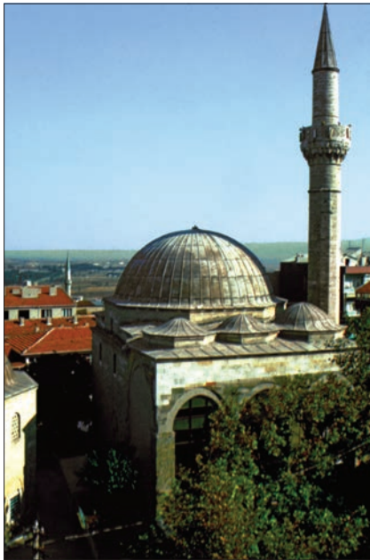
Gazi Ömer Bey Camii – Malkara / Tekirdağ

Gaznevî'nin günümüze ulaşan tek eseri olan Tefsîrü'l-fuḫahâʿ ve tekzîbü's-süfehâʿ fikhî yönüyle dikkat çeken bir dirâyet tefsiridir. İki tam (Süleymaniye Ktp., Mihrişah Sultan, nr. 24, 25, 26; Beyazıt Devlet Ktp., nr. 562), ikisi eksik (TSMK, III. Ahmed, nr. 84; Hizânetü'l-Karaviyyîn, nr. 49) olmak üzere dört nüshası bulunan