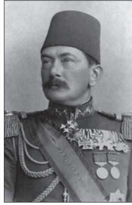
Wilhelm Colmar von der Goltz

ordu reformlarına gerektiği kadar önem vermediği kanaatinde, padişahın etrafındaki eski paşaları da "üniformalı saray soytarıları" diye niteler. Ordunun silâh alımlarında Almanya'nın tercih edilmesindeki etkisi vatanına dolaylı hizmeti oldu. 1000 ağır topun Krupp Şirketi'ne sipariş edilmesi yanında yüz binlerce mavzerin satın alınması, Boğazlar'ın savunması için Schichau Tersanesi'nde torpido yapımı sebebiyle kendisine şahsî çıkar sağladığı gibi söylentiler büyük bir ihtimalle doğru değildir. Deutsche Revue 'de Ağustos 1914'te çıkan bir makalesinde bu konuya değinen Goltz, yüksek ahlâkî değerlerini kaybetmiş idareci kadrosuna sahip milletlerin çöküşünün kaçınılmaz olduğunu belirtmekteydi.