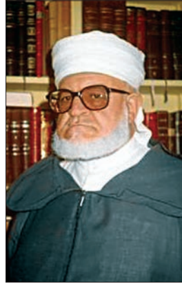
Abdülazîz b. Muhammed el-Gumârî

Eserleri. 1. el-Bâhîş 'an 'ileli't-ıta'n fi'l-Hâriş (Kahire 1426/2005). Müellif bu eserinde Kûfeli hadis râvisi Hâris el-A'ver'e yöneltilen eleştirileri, bilhassa hemşehrisi Şa'bî'nin eleştirilerini cevaplayıp onun güvenilir bir muhaddis olduğunu göstermeye gayret etmiştir. Gumârî aynı konuda, Muhammed Nâsîrüddin el-Elbânî'ye rediye olarak Beyânü nekşî'n-nâkiş li'l-müte'addî bi-taz'ifi'l-Hâriş adlı bir eser de kaleme almıştır (Amman 1412/1992). 2. el-Buğye fi tertîbi ehadîsi'l-Hilye (Kahire, ts. [Mektebetü'l-Hancî]). Ebû Nuaym'ın Hilyetü'l-evliyâ'sında geçen hadisleri "hurûf" ve "ef'âl" başlıkları altında bir araya getirmiştir. Hurûf bölümündeki hadisler etrâf tertibinde (hadislerin yalnızca baş kısımlarına göre alfabetik biçimde) sıralanırken bu başlığa girmeyen hadisler sahâbî adına göre ilgili olduğu konuda zikredilmiştir. 3. Hüküm tanzîmî'l-üsre ev taħdîdî'n-nesl (Filistin 1428/2007). Gumârî'nin evlilik, aile ve doğum kontrolü hakkındaki görüşlerini içermektedir. 4. İthâfû zevî'l-himemi'l-âliye bi-şerhi'l-âşmâviyye (Beirut 1408/1988). Eserde Mâlikî fakih Abdülbârî el-Âşmâvî'nin ibadetlere dair el-Muḥaddimetü'l-âşmâviyye'si şerhedilip eserdeki hükümlerin delilleri ortaya konulmuştur. 5. el-Kav-lü'l-esed fi beyâni hâli (fi ibtâli) hadîsi "Ra'eytü Rabbi fi şüreti şâbbin emred" (Amman 1428/2007). "Rabbimi