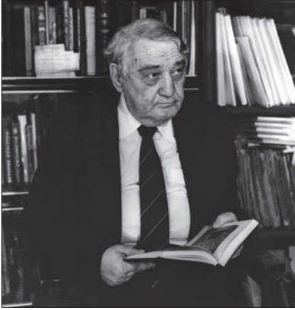
Lev Nikolavich Gumilev

Annesinin Stalin'e ve diğer devlet büyüklerine yazdığı mektuplar üzerine serbest bırakıldıysa da Mart 1938'de arkadaşlarıyla birlikte Stalin, Molotov, Jdanov gibi devlet adamlarına suikast hazırlığı içinde buldukları gerekçesiyle dördüncü sınıfta iken hapse atıldı, çalışma kampında on yıl kalmakla cezalandırıldı. Rusya'nın kuzeyinde insan gücüyle inşa edilmekte olan Belenor Kanalı'nda çalıştırıldı. Avukatının itirazı üzerine davasına yeniden bakıldı ve 26 Temmuz 1939'da cezası beş yıla indirildi. Rusya'nın en kuzeyinde Dudinka ve ardından Norilsk'teki kampta maden ocaklarında ağır işlerde çalıştıktan sonra kampın kimya laboratuvarına alındı. Maden ve laboratuvar etkinlikleri sırasında kimya bilgisini geliştirdi. Rusya'nın II. Dünya Savaşı'na girmesi ve ham madde ihtiyacının artması üzerine kamptaki mahkûmlardan bu yönde faydalanma ihtiyacı doğdu ve Gumilev, Sibirya'nın çeşitli bölgelerinde maden araştırmaacılarıyla birlikte inceleme gezilerine katıldı. Bu geziler sırasında Sibirya'da yaşayan Türk halklarını yakından görme imkânı buldu.