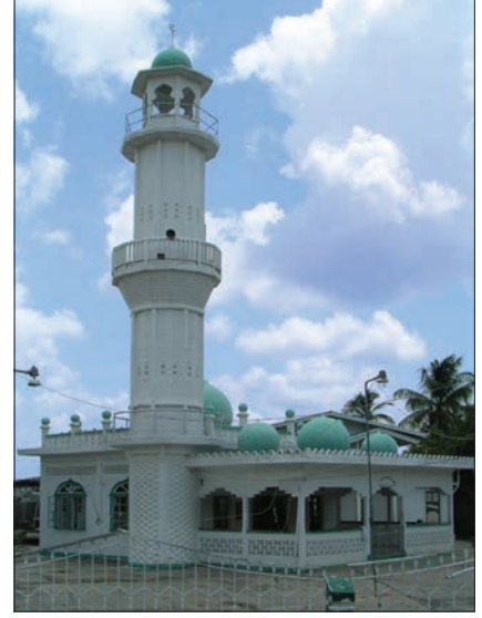
New Amsterdam Camii – Guyana

Yeni yerleşimcilere ihtiyaç duyan Hollandalılar 1746'dan itibaren Guyana'ya İngilizler'in yerleşmesine izin verdiler. 1760'ta bölgede çoğunluğu ele geçiren İngilizler, Hollanda Batı Hindistan Şirketi'nin 1770'lerdeki idarî reformları sebebiyle artan masrafları karşılamak üzere vergileri arttırması yüzünden Hollandalılar'a karşı 1781'de savaş başlatarak Berbice,