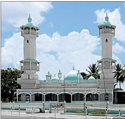
Skeldon'da bir cami

1979 yılında müslümanlara yardım için oluşturulan The Central Islamic Organization of Guyana zamanla büyüyerek gayri müslimlere de yardımlarda bulunmakta, özellikle eğitim ve yoksulluk gibi alanlarda çalışmaktadır. Hujjatul Ulamaa, Muslim Youth Organization, Guyana Muslim Mission Limited ve Tabligh Jammât, the Rose Hall Town Islamic Center gibi başka kuruluşlar da faaliyet göstermektedir. Ülkede ramazan ve kurban bayramları resmen tatil olup ayrıca mevlid kandili kutlanmaktadır. Guyana 1998'de İslâm İşbirliği Teşkilâtı'na (İslâm Konferansı Teşkilâtı) üye olmuştur. Büyük kısmı tarımla uğraşan, bir kısmının işletmeleri bulunan Guyana'daki müslümanlar parlamentoda ve çeşitli bakanlıklarda temsil edilmektedir. Müslümanlar ülkede 130 civarında cami inşa etmişlerdir.