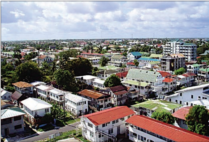
Başşehir Georgetown'dan bir görünüşü

1834'te köleliğin yasaklanması üzerine köleler eski sahiplerinin yanında maaşla çalışmaya başladılar. XIX. yüzyılın ikinci yarısından itibaren Hindistan'dan çok sayıda tarım işçisi getirildi. 1905'te çıkan Ruimveldt işçi isyanı İngiliz birlikleri tarafından bastırıldı. 1928'de kabul edilen yeni anayasayla ülke vali yönetiminde bir İngiliz kolonisi haline getirildi. 1930'lardaki "büyük buhran" Guyana'yı da etkiledi. Ülkenin en önemli gelir kaynakları olan şeker, pirinç ve boksit fiyatlarının düşmesi