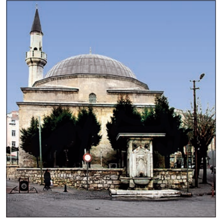
Hızır Bey Camii – Kırklareli

Yapının mihrabı son derece yalın, yarı silindirik, genişçe bir niş halindedir. İki yanında pilastırlar olan dikdörtgen bir çerçeveye içine alınmış, Batı tarzında boyanmış abartılı bir tohoz, meyve ve çiçek sepetleriyle taçlandırılmıştır. Ahşap minber ve vaaz kürsüsü de sade geometrik bezemeler içerir. Harimin kuzeybatı köşesindeki ahşap korkuluklu merdiven kadınlar mahfiliyle bağlantıyı sağlar. Altı adet ince direk üzerine oturan bu bölümün döşemesi parmaklıklarıyla birlikte ahşaptır ve orta kısmı kible yönünde yarım daire şeklinde barok profilli bir çıkma yapmaktadır. İki kat olarak düzenlenen son cemaat yeri, üstü kiremit kaplı hafif eğimli bir çatıyla örtülüdür. Giriş cephesinde beş, iki yan cephesinde ikişer kemerle teşkilâtlandırılmıştır. Bu bölümün kible yönündeki duvarında ana eksende harim kapısı, bunun iki yanında birer pencere ile yarı silindirik