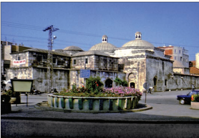
Hızır Bey Arastası ve Hamamı

Caminin güneyinde yol aşırı karşısında bulunan Hızır Bey Hamamı'nın inşa kitâbesi yoktur. Fakat Evliya Çelebi'nin anlatımından hamamın camiyle birlikte