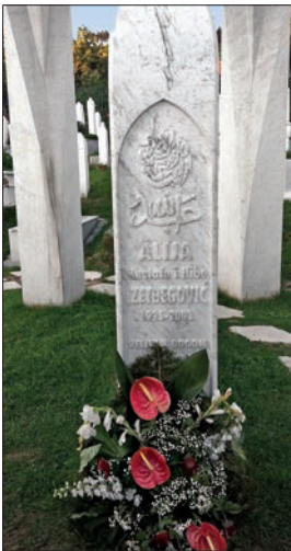
Aliya İzzetbegović'in mezarı

İzzetbegović devlet ve topluma bakış açısını ahlâk ve içtimâî hassasiyet temelinde inşa etmiştir. Gelişim ve gerilim hakkındaki tartışmaları geneldir; onda bireyin, toplulukların, kurumların, liderlerin ve milletlerin ahlâki ve bilgeliği esastır. İslâmî ilke ve değerler evrensel olup zamanla sınırlanmamıştır, çünkü bunlar zamana hükmeden Allah'tan gelmektedir. Değerleri, dini ve gelenekleri korumak, tarihsel ve toplumsal olguların içinde bulunmak ve onları dikkate almakla mümkündür. Müslüman milletler tarihin bıraktığı tortulardan kurtulup asıllara, İslâm'ın temel kaynaklarına dönmeli ve kendi idealleri için aktif olmalıydılar. İslâm'ın konumu her zaman evrenseldir, İslâm kültür ve medeniyeti bir zamanlar müslüman topraklarında çiçek açmıştır. Bu mekânlar "İslâmiyet'in Piyemontu" olup dünyanın diğer taraflarını ışıktandırarak medeniyetler arasında diyalog ve anlayış kuracaktır. "Kendini yeniden bulma" konusunda İslâm'ın başlangıcından beri yapılanlar yapılmaya devam edilmelidir. Bu ise iyi olan her şeyi benimsemekle mümkündür.