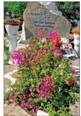
Cevat Şakir Kabaağaçlı'nın Bodrum'daki mezarı