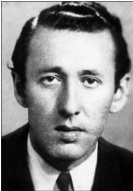
Orhan Veli Kanık

Şiirin finalinin ironi, parodi gibi tekniklerle sağlanan bir noktaya bağlanması Orhan Veli'nin başlıca özelliklerindedir. Şairin bu anlayışla yazdıkları önce hece vezni geleneğinden gelen şairler, daha sonra toplumcu gerçekçiler, Attila İlhan ve İkinci Yeni şairleri tarafından eleştirilmiştir. Buna karşılık espri ile duyguyu birleştirip konuşma dili edasıyla yazdığı şiirleriyle kısa zamanda popüler hale geldiği gibi Türk edebiyatında vezinli kafiyeli, şiire özgü kelime ve söyleyişler içeren eski anlayış Garip hareketinden sonra terkedilmiştir. İkinci Yeni ve daha sonraki modern Türk şiiri bu açıdan Orhan Veli'ye çok şey borçludur. Onun yeni tarzdaki şiirlerinin başlangıçta Fransız sürrealistleri, 1945'ten itibaren halk edebiyatı ürünlerinin etkisini taşıdığı kabul edilmektedir. Şiirlerinin içerik bakımından en önemli özelliği küçük şeyleri ve küçük adamı konu edinmesidir. "Kitâbe-i Seng-i Mezar" şiirindeki "Yazık oldu Süleyman Efendi'ye" dizesinin, zamanında