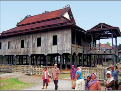
Kompong Cham'da bir köy camii

baskı, öte yandan iktisadî gelişme önünde engel teşkil eden katı siyasî rejim, askerî güçle ülkede muhalefeti temsil eden bütün kesimleri yok etme savaşına girdi. Rejimin katlettiği 2 milyondan fazla insan arasında 200.000'e yakın müslümanın bulunduğu tahmin edilmektedir. Bu süreçte 183 cami ve çok sayıda Kur'an okulu yerle bir edildi. 1975'te müslümanların bir köyde rejime karşı başlattıkları isyan kanlı bir şekilde bastırıldı. Rejim Çamca, Malayca ve Arapça konuşup yazmayı yasakladı. Bu politikalar çerçevesinde Kur'an ve dinî kitapların tamamı yakıldı. 1978'de Vietnam'ın ülkeyi işgaliyle komünist rejim son bulurken bu kanlı yıkımların da durmasını sağladı. Ancak müslümanların yeni siyasî ortamda toparlanması Vietnam'ın ülkeden çekilmesiyle başladı. İslâm ülkelerinden Kamboçya'ya gelen İslâmî teşkilâtlar ve cemiyetler müslümanların yeniden toparlanmasına büyük destek ve katkı sağladı.