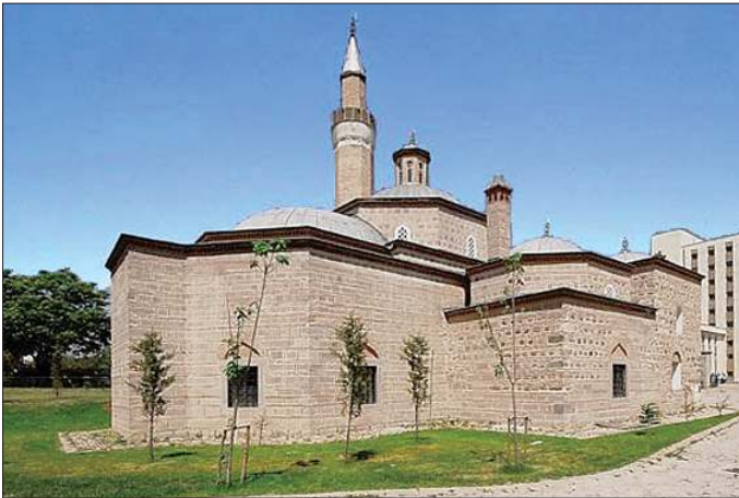
Karaca Bey Camii - Ankara

Caminin kuzeybatısında yer alan türbe kapısı üzerindeki sülüs yazılı kitâbeden anlaşıldığı gibi Karaca Bey'e aittir. Kitâbede Karaca Bey'in 848 (1444) yılında vefat ettiği kayıtlıdır (Varna Muharebesi'nde şehid düşmüştür). Türbenin kusağına yerleştirilen bir başka kitâbe, 1211'de (1796-97) Pîr Mehmed tarafından gerçekleştirilen tamiri belgeler. 1943'te kubbesi ve pencere şebekeleri restore edilmiştir. Son onarım 2005 yılında gerçekleştirilmiştir. Taş ve tuğla ile almaşık örgülü duvarlara sahip olan yapı sekizgen planlı olup üzeri kasnaklı bir kubbeye örtülmüştür. Kuzeydoğu cephesinde dışa taşkın, üzeri tonoz örtülü eyvan şeklindeki girişi Bursa kemerlidir. Türbe beden duvarlarıyla kasnağının üzerinde yer alan on beş pencereyle aydınlanmaktadır. Alt sıradaki pencereler ahşaplı ve taş süslemeli alınlıklara sahipken üst sıradakiler yuvarlak kemerli ve alçı şebekelidir. Türbenin içinde üç adet