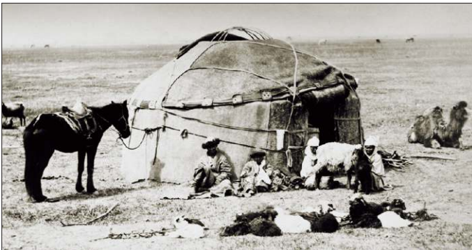
1860 tarihli bir albüme cadını önünde Kırgız ailesini gösteren fotoğraf

Kırgızlar hakkında basılı matbuatta ilk ciddi bilgiler N. M. Prjevskiy, P. P. Semenov, Tyanşanskiy, H. A. Severtsov, I. V. Muşketov ve A. P. Fedçenko gibi Rus seyyahları tarafından verilmiştir. Kırgızistan topraklarının Ruslar tarafından işgal edilmesinden sonra Rus bilim adamlarının Kırgızlar'ın tarihi, dili, edebiyatı ve etnografyası üzerine ilgisi arttı. Kırgız tarihi, dili ve edebiyatına dair araştırma ya-