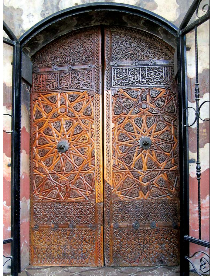
Koca Mehmed Paşa Camii’nin süslemeli ahşap kapı kanatları

Koca Mehmed Paşa, Osmanlık’ta iki hamam yaptırmıştır. Evliya Çelebi’nin bahsettiği hamam ( Seyahatnâme , III, 178) 1960’lı yıllarda yıkılmıştır. Halen mevcut durumdaki hamam ise Kızılırmak sahilinin yakınında çarşı içinde Aşağı Hamam denilen yapıdır. Bir kuşluk hamamı (kadınların ve erkeklerin nöbetleşe kullandıkları) olan yapının kitâbesi yoktur. Dikdörtgen planlı yapının soyunmalık kısmının üzerini sekizgen kasnağa oturan 8,25 m. çapında bir