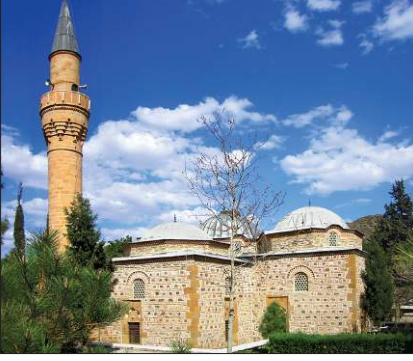
Koca Mehmed Paşa Camii – Osmanlık / Corum

len kapsamlı çalışmayla caminin mihrabı, minberi ve kapı kanatları restore edilmiş, önüne sundurma şeklinde ahşap bir son cemaat yeri ilâve edilmiştir. Hazîresinde bakımsız durumda olan taş sandukalar 2011’de Osmanlık Belediyesi tarafından temizlenerek caminin doğu yanındaki boş alana aktarılmıştır.