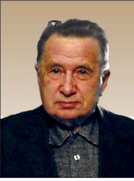
Sergey Grigorevič Klyastorniy

bul edildi. 1986-1996 yıllarında Kazakistan İlimler Akademisi Uygur Araştırmaları Enstitüsü'nde seminer ve ders vererek enstitü kadrolarının yetiştirilmesine hizmet etti. Sovyetler Birliği döneminde Türk tarihi hakkında çalışan pek çok akademisyenin ilmi danışmanlığını yaptı ve ülkede Türkoloji'nin gelişmesine büyük yardımları oldu. Düzenli biçimde Türkoloji konferansları tertip etti. Altı ciltlik İstoriya Tatar (Kazan 2002), Tatarica Atlası (Moskova 2005), Voljskaya Bulgariya i Velikaya Step (Volga Bulgaryası ve büyük bozkır) (Kazan 2006) gibi önemli eserlerin hazırlanması projelerinde görev aldı. Bazı kitapların editörlüğünü yaptı ( Arhivnie materialy o mongolskih i tyurskih narodah v akademičeskih sobraniyah Rossii [Rus akademik koleksiyonlarında Moğol ve Türk toplulukları hakkında arşiv belgeleri]) (Petersburg 2000); Rossiya i tyurskiy mir (Rusya ve Türk dünyası) (Moskova 2002); İstoriya Vostoka (Doğu tarihi) (I-II, Moskova 2009). Sergey 21 Eylül 2014'te Petersburg'da öldü.