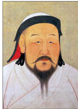
Kubilai Kağan'ı tasvir eden yağlı boya resim (Taipei National Palace Museum)

23 Eylül 1215 tarihinde doğdu. Cengiz Han'ın en küçük oğlu Tuluy ile Büyük Hatun Sorkaktani'nin ikinci oğludur. Moğol geleneğine göre büyütülmesi için önce Nayman ve ardından Tangut kabilesinden kadın bakıcılara verildi. Çocukluğunda iyi bir eğitim aldı. 1225'te başarılı geçen ilk avından sonra Moğol âdetince dedesi Cengiz Han tarafından parmaklarına et ve yağ sürüldü. Ağabeyi Mengü Kağan zamanında Şan-si ve Honan eyaletlerinin idaresiyle Sung hânedanı hâkimiyetindeki Çin'in zaptıyla görevlendirildi. 1253'te Nan-çan Devleti'ne son verdi. 1259'da Mengü Kağan'ın vefatı üzerine Sung Devleti ile barış yaparak Moğolistan'a döndü ve en küçük kardeşi Arıkboğa ile (Arık Buka) taht mü-