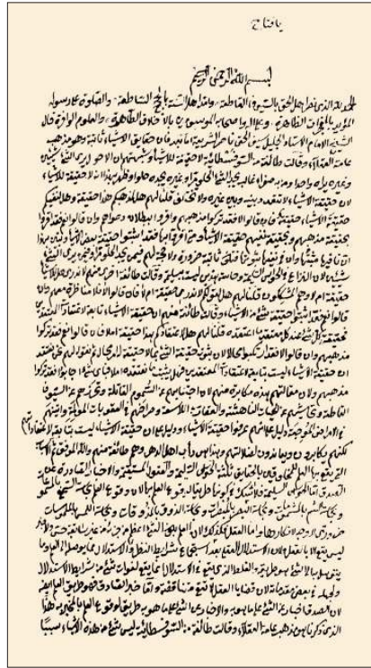
Lâmişî'nin et-Temhid li-kavâ'id-i't-tevhîd adlı eserinin ilk sayfası (Süleymaniye Ktp., Erzincan, nr. 159/5)

Eserleri. 1. et-Temhid li-kavâ'id-i't-tevhîd. Yazma nüshalarında Risâle fi uşûli'd-dîn , ‘Aqâ'idü'l-Lâmişî gibi isimlerle de kaydedilen eserde kelâm konularını Mâtürîdîye mezhebi çerçevesinde ele alınır (bk. bibl.). Hacı Selim Ağa Kütüphanesi'nde (nr. 587, vr. 114-144) et-Temhid ma'a şerhihi fi mevâzi'i't-tecrîd adıyla bir şerh mevcuttur (Şık, s. 48). 2. Kitâb fi uşûli'l-fıkh. Fasıllar şeklinde düzenlenen eserde fıkıh terimlerinin tanımı, hakikat-mecaz, şer'î hükümler, hüsün-kubuh, emir-nehiy, âm-hâs, illet, haber, icmâ, nesh, kıyas ve istishâb konuları Hanefî usul-i fikhî çerçevesinde incelenir. Hâlid b. Ali Hâmid el-Gannâm et-Temîmî, eseri Medine İslâm Üniversitesi'nde yüksek lisans tezi olarak neşre hazırlamış (1414), Abdülmecid Türkî de ayrıca neşretmiştir (bk. bibl.). 3. Keşfü'l-elfâz. Dinî ve özellikle fikhî bazı kavramların açıkladığı bir risâledir. Muhammed Hasan Mustafa Çelebi, bir nüshası İskenderiye Kütüphanesi'nde