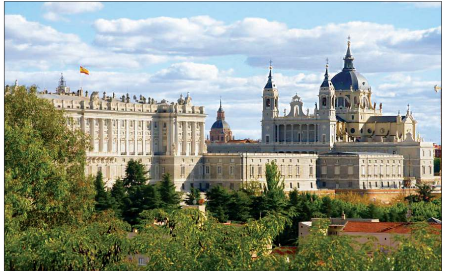
Madrid Kraliyet Sarayı ve Almudena Katedrali

Madrid'in başşehir olmasından itibaren hız kazanan imar faaliyetleri XVII. yüzyılın başında tahta çıkan III. Felipe döneminde devam etti. Şehrin ana meydanı (Plaza Mayor) bu dönemde inşa edildi ve İspanya'nın