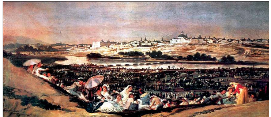
Goya'nın Madrid'i tasvir eden tablosu (Madrid Prado Müzesi)

Madrid Arkeoloji Müzesi başta olmak üzere şehirdeki müzelerde İslâmî döneme ait pek çok tarihî eser mevcuttur ( a.g.e. , s. 335-340). İslâmî kaynaklar bakımından Madrid kütüphanelerinin en önemlileri