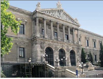
Madrid'de Millî Kütüphane