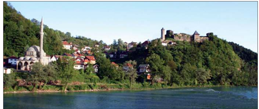
Maglay'dan bir görünüş

1528'de Maglay çoktan bir kaza merkezi haline gelmişti. Bu da şehir hüviyetini kazanabilmek için asgari yeterlilikler olan bir çarşı ile bir cuma camisine epeydir sahip bulunduğu anlamına gelir. Nüfusun İslâmlaşması, Kuzeydoğu Bosna'nın diğer