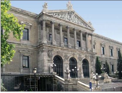
Madrid'de Millî Kütüphane