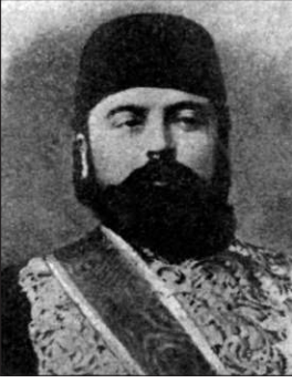
Damad Mahmud Celâleddin Paşa

da mallarını müsadere etmedi. Firardan sonra Avrupa'daki Osmanlı sefirlerinin en önemli işi paşanın takip ve iade edilmesiyle ilgili çalışmalar oldu.