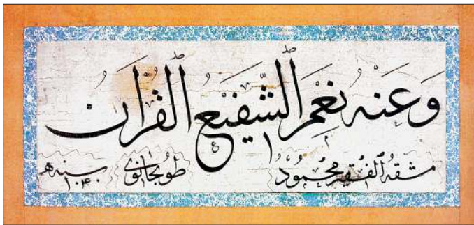
Tophâneli Mahmud Nûri'nin sülûs kıtası (Süleymaniye Ktp., Süleymaniye, nr. 9/19)

Kaynaklarda Mahmud Nûri'nin sülûs, nesih, celî ve nesta'likte zamanının en kudretli hattatı olduğu, özellikle nesta'lik hattının Osmanlı ülkesinde Dervîş Abdî-yi Mevlevî'den sonra onun vasıtasıyla yayıldığı kaydedilir. Fakat hat sanatında böyle üstün bir mevki kazanmasına rağmen Mahmud Nûri'nin günümüze ancak sayılı birkaç eseri ulaşabilmiştir. Sülûs, nesih yazısına tek bir örnek 1040 (1631) tarihli icâze hattıyla "Mahmud Tophânevî" kebeli bir murakka' içinde yer alan kıtasıdır (Süleymaniye Ktp., Süleymaniye, Murakkaât, nr. 9/19). Celî sülûs yazıda ise günümüze ulaşmış iki eseri bilinmektedir. Bunlardan biri, Topkapı Sarayı Bağdat Köşkü'nün iç tezyinatı yapılırken IV. Murad'ın fermanı üzerine hazırladığı alt pencerelerle renkli camlı tepe pencereleri dizisi arasında yer alan mavi çini üzerine beyazla celî sülûs kuşak yazısıdır. Etkili ve zengin görünüşlü bu çini kitâbede besmele ve Bakara sûresinin 255. âyetinden (Âyetü'l-kürsî) 261. âyetin sonuna kadar