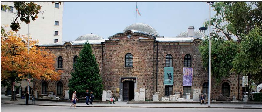
Mahmud Paşa Camii – Sofya / Bulgaristan