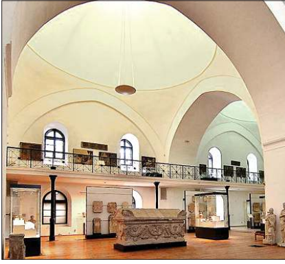
Müze olarak kullanılan Mahmud Paşa Camii'nin içinden bir görünüş

minberi, mahfil ve mihrap gibi kısımları da tamamen ortadan kalkmıştır.