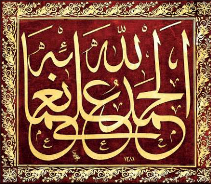
Mehmed Şevket Vahdetî'nin katı' celi sülüs levhası