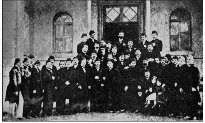
Mekteb-i Osmânî öğretmen öğrencilerinden bir grup

1968, s. 313-329; Osman [Nuri] Ergin, Türkiye Maarif Tarihi , İstanbul 1977, II, 454; Bayram Kodaman, Abdülhamid Devri Eğitim Sistemi , İstanbul 1980, s. 8-28; Yahya Akyüz, Türk Eğitim Tarihi (Başlangıçtan 1993'e) , İstanbul 2001, s. 133-134; Selçuk Akşin Somel, The Modernization of Public Education in the Ottoman Empire: 1839-1908 , Leiden 2001, s. 52-53; Vahdetin Engin, 1868'den 1923'e Mekteb-i Sultani , İstanbul 2003, s. 21-24; Adnan Şişman, Tanzimat Döneminde Fransa'ya Gönderilen Osmanlı Öğrencileri: 1839-1876 , Ankara 2004; a.mlf., "Egyptian and Armanian Schools Where the Ottoman Students Studied in Paris", Frontiers of Ottoman Studies (ed. C. Imber – K. Kiyotaki), London 2005, II, 157-163; a.mlf., "Mekteb-i Osmânî (1857-1864)", Osm.Ar. , sy. 5 (1986), s. 83-160; a.mlf., "Tanzimat Döneminde Fransa'ya Gönderilen Gayr-i Müslim Osmanlı Öğrencileri", TTK Bildiriler , X (1994), V, 2515-2533; a.mlf., "XIX. Yüzyılda Avrupa'ya Gönderilen Osmanlı Öğrencileri", a.e., XII (1999), III, 963-971; Mehtap Ay, Paris Mekteb-i Osmânî'sinin Kuruluş, Amaç ve İşlevi (yüksek lisans tezi, 2007), AÜ Sosyal Bilimler Enstitüsü, s. 1-106; İbrahim Hakkı Akyol, "Son Yarım Asırda Türkiye'de Coğrafya", Türk Coğrafya Dergisi , sy. 2, Ankara 1943, s. 121-136; Ömer Faruk Akün, "Hoca Tahsin", DİA , XVIII, 199; Cemil Öztürk, "Selim Sâbit Efendi", a.e., XXXVI, 429-430; Muhtittin Serin, "Şeker Ahmed Paşa", a.e., XXXVIII, 487-488.