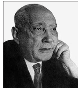
Muhammed Abdullah İnân

7 Temmuz 1898'de Mısır'ın Miftgamr şehrinin Beşlâ köyünde doğdu. Hilâlî Arapları'na mensup bir aileden gelmektedir. Ailesi 1901'de Kahire'ye taşındı. İlk ve orta öğrenimini Kahire'de tamamladı. 1914'te Medresetü'l-hukûkussultâniyye'de tahsile başladı ve 1918'de buradan mezun oldu. Bir süre avukatlık yaptı. 1921'den itibaren telif ve tercüme işleriyle meşgul oldu. Bu çalışmaları esnasında tarihî meseleler ilgisini çekmeye başladı ve İslâm tarihinin çeşitli konularına dair makaleler yazdı. Bu makaleleriyle İngilizce, Fransızca ve Almanca'dan yaptığı edebiyata dair çeviriler el-Hilâl, es-Siyâse, es-Siyâsetü'l-Üs-