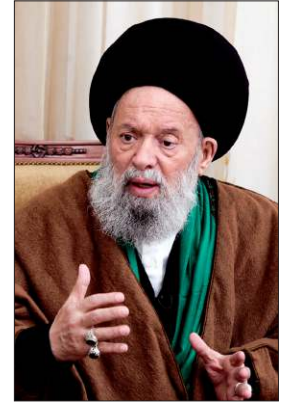
Muhammed Hüseyin Fazlullah

1989'da otuz kadar Şîî ulemâsının Muhammed Hüseyin'in müctehid olduğu hususunda şehâdetinde bulunması ve kendisinin merci-i taklid olarak kabul edilmesi üzerine önce "âyetullah" ve ardından "âyetullahî'l-uzmâ" unvanını aldı. Öte yandan dönemin bazı âlimlerinin düşüncelerine muhalefet etti. Humeyni'nin velâyet-i fakih görüşünü benimsemeyip Lübnan'da bu düşüncenin bir değer ifade etmeyece-