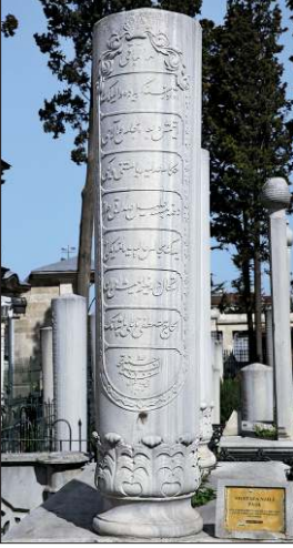
Mustafa Nâilî Paşa'nın Fâtih Camii haziresindeki mezar taşı - İstanbul

onu Mustafa Reşid ve Âlî paşalara karşı bir denge unsuru olarak kullanmıştı. Sadâretten alınmasının ardından Mart 1858'de Mecâlis-i Âliye'ye memur edildi. 19 Aralık 1861'de birinci rütbeden Osmanlı nişanı ile taltif edildi (BA, A.DVN.MHM, nr. 35/85).