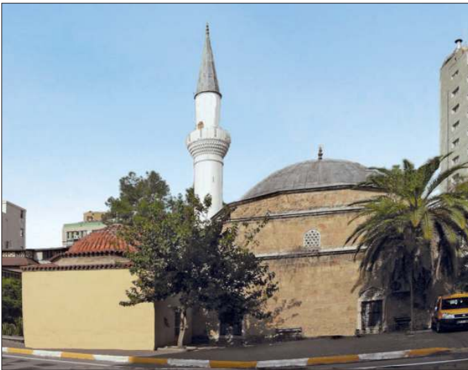
Müsellim Camii ve Kütüphanesi - Antalya

Cami kare planlı (10 x 10 m.) ve tek kubbeyle örtülü bir harime sahiptir. Kurşun kaplı olan ve sekizgen kasnağa oturan kubbeye geçiş tromplarla sağlanmıştır. Tromplar dışarıdan yine sekizgen, ancak birinciye göre daha yüksek bir kasnakla gizlenmiştir. Bunun altında kalın beden duvarları bulunmaktadır. Beden duvarlarında bir sıra halinde düzenlenmiş dikdörtgen sekiz pencere ile tromplar arasın-