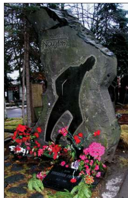
Nazım Hikmet'in Moskova'daki mezarı

Bu tarihten itibaren çeşitli ülkelere seyahatlerle geçen yeni bir dönem başladı. Önce Berlin ve Sofya'ya gitti, Viyana'da Dünya Barış Kongresi'ne katıldı ve açılış konuşmasını yaptı. Prag'da Uluslararası Barış ödülünü aldı, oradan Pekin'e geçti. Polonya seyahati sırasında Borjenski soyadı adına bir kimlik çıkartıldı (1952). Sovyet bürokrasisindeki yozlaşmayı ağır bir dille eleştiren İvan İvanoviç Var mıydı Yok muydu? adlı oyunu Moskova'da kısa sürede sahneden kaldırıldıysa da (1957) Çekoslovakya, Bulgaristan ve Doğu Almanya gibi ülkelerde birçok defa sahnelendi. 1961'de Sovyetler Birliği pasaportuyla Asya-Afrika Yazarlar Birliği konferanslarına katılmak üzere Kahire'ye (1962) ve Tanzanya'ya (1963) gitti. 3 Haziran 1963'te Moskova'da kalp krizinden öldü.