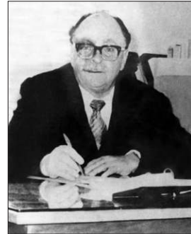
Ahmed Selim Saîdân

1912 (veya 1914) yılında Filistin'in Safed şehrinde doğdu. İlk ve orta öğrenimini Safed'de yaptı, liseyi Kudüs'te okudu. Lisans eğitimini matematik alanında Beyrut Amerikan Üniversitesi'nde tamamladı (1934). 1934-1948 yıllarında Kudüs'teki el-Külliyetü'r-Reşîdiyye ve el-Külliyetü'l-Arabiyye liselerinde matematik hocalığı yaptı, liseler için çok sayıda matematik kitabı kaleme aldı ve Kudüs Radyosu'nda bilimsel haberlerin yayımıyla ilgilendi. 1948'de Londra Üniversitesi'nden matematik alanında ikinci lisans derecesini aldı. 1948-1969 yıllarında Sudan hükümetinin daveti üzerine Hartum Üniversitesi'nde ders verdi. Bu süre zarfında Sudan okullarında okutulmak üzere matematik kitapları yazdı. Doktorasını da Hartum Üniversitesi'nde Hint-Arap aritmetiğinin gelişimi hakkındaki teziyle 1966'da bitirdi. 1969'da Ürdün Üniversitesi Fen Fakültesi'ne geçerek profesör unvanı aldı ve emekliye ayrıldığı 1979 yılına kadar fakültenin dekanlığını yürüttü. Ebü Dîs Üniversitesi'nin kuruluşuna başkanlık etmek üzere 1979'da Kudüs'e yerleşen Saîdân, İsrail yönetimi tarafından 1981'de görevinden uzaklaştırıldı.