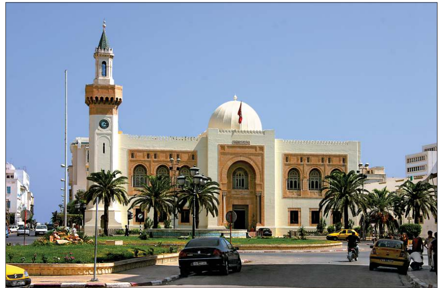
Sefâkus belediye binası

Ya'kübi, el-Büldân (nşr. M. Emîn Dannâvî), Beyrut 1422/2002, s. 189; İbn Havkal, Şûretü'l-arz (nşr. M. J. de Goeje), Leiden 1873, s. 47; Bekrî,