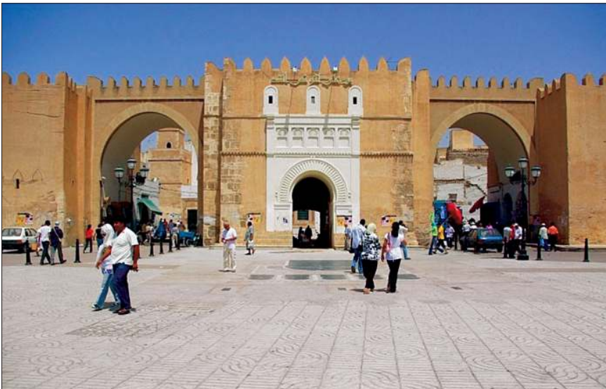
Sefâkus'taki ziyaret yerlerinden Bâbüddivân

1830'da Avrupalılar'ın oturduğu mahalle surla çevrildi. Bu mahalleye yerleşmiş olan yahudilerle birlikte Avrupalı göçmenler 1875'ten itibaren ithalât ve ihracat işlerini tekelleri altına aldılar. Sefâkus halkı ise harap duruma gelen zeytinliklerini imar için zeytin ağacı yetiştirmeye yöneldi. Zeytincilik canlandı ve Sefâkus yeniden Akdeniz havzasında zeytinyağı ihraç eden en önemli şehirlerden biri oldu. 1835'te Sefâkus'u ziyaret eden Alman Hermann von Pückler-Muskau zeytin, zeytinyağı ve dokumaların yanı sıra Cerîd bölgesinden getirilen hurma, kına, bal ve mum, Cerbe'den getirilen çömleklerle Sefâkus'un önemli bir ticarî merkez haline geldiğini söyler. Timbükü gibi Kara Afrika ticaret merkezleriyle de ilişkileri gelişen şehrin sabun, bornoz, yün ve ipek kumaşlarıyla meşhur olduğunu, 14.000'i içinde ev bulunan 50.000 bahçenin şehri kuşattığını, bahçelerde bol miktarda ceviz, fıstık, hurma, incir, nar yanında çeşitli meyvelerin yetiştirildiğini zikreder (Cum'a Şîha, s. 37-40). 1840'ta Sefâkus'a uğrayan Fransız seyyahı E. P. de Reynaud ise şehrin mevkii, konumu, surları, sur kapıları, mahalleleri