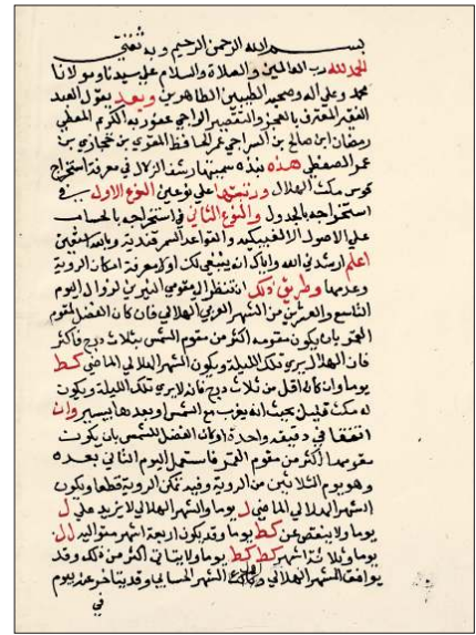
Seftî'nin Resfü'z-zılâl adlı eserinin ilk sayfası (Nuruosmaniye Ktp., nr. 2895/3)

kamer bi-ḫariḳi'd-Dürri'l-yetîm (İbnü'l-Mecdî'nin astronomi cetvellerini ihtiva eden ed-Dürri'l-yetîm ile ilgili bir çalışmadır); Kitâbü'z-Zic; Kitâbü Cedâvil-l-kevâkibi's-sâbite bi-raşadi Uluğ Beg sene 1136; ed-Derecâtü'l-verîfe fi taḫrîri kısseyi'l-'asri'l-evvel ve 'asri Ebî Ḥanîfe; Cedveli mevḳı'ı 'aḳrebi's-sâ'ât 'alâ evḳâti'l-'ibâdât; Nebzeten müfide fi ma'rifeti istiḫrâci'd-dâ'ir; Cedâvil li-resmi'l-münḫariḫât li-'arzin; Risâletün 'azîme fi ḫarekâti'l-eḫlâki's-seyyâre ve hey'âtiḥâ ve ḫarekâtiḥâ ve terkibi cedâvilihâ 'ale't-târîḫi'l-'Arabî 'alâ uşûli'r-raşadi'l-cedîd; Neticetü'l-efkâr fi a'mâlî'l-leyl ve'n-nehâr, ed-Dürri'l-ferîd 'ale'r-raşadi'l-cedîd (eserlerin yazma nüshaları ve tavsifleri için bk. King, s. 111; İhsanoğlu v.dğr., I, 419-426; Rosenfeld – İhsanoğlu, s. 401).