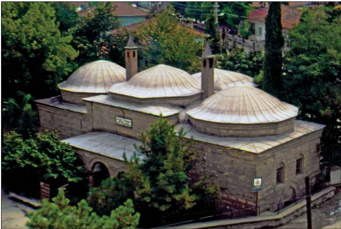
Sinan Bey Zâviyesi – Geyve / Adapazarı

Tabhâneli yapıların önemli örneklerinden biri olan Sinan Bey Zâviyesi ana eksen üzerinde birbirini izleyen, biri kubbe, diğeri aynalı tonozla örtülü iki ayrı mekânın oluşturduğu merkezî bölümler giriş sofası ve iki yandan bağlantılı odalardan meydana gelir. Kuzey cephesinde yer alan elemesine dikkâdörtgen planlı revak bu tipin diğer örneklerinden çok farklıdır. Oldukça dar boyutlardaki bu kısım, pâyelerin üstüne atılan dairevî kemerler üzerine kubbeli to-