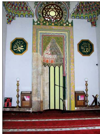
Sinan Paşa Camii'nin mihrabı ve müezzin mahfili

Camide yoğun biçimde varlığını kabul ettiren süsleme Batılılaşma döneminin özelliklerini taşır. Bu yapı Türk baroku üslûbunun Balkanlar'daki önemli örneklerinden biridir. Kalem işi bezemelerde motifler, buket halinde veya vazolara konan değişik çiçekler, sepet ve kapların içine konmuş meyvelerden oluşan natüristikler, barok üslûba özgü sert hatlı "S" ve "C" formu sarmal bitkiler, madalyonlar, sütunlara bağlı perdeler kullanılmıştır. Bunun yanı sıra peyzaja da yer verilmiştir. Mihrap duvarının üzerindeki bir panoda üçer şerefeye sahip dört adet minaresi olan kubbeli büyük bir cami tasvir edilmiştir. Bezemelerdeki renkler mavi, kırmızı, yeşil, sarı, siyah ve kirlili beyazdır. Süsleme tarzı ve işçilik Prizren'de 1247 (1831-32) yılında inşa edilen Emin Paşa Camii ile benzerlik göstermekte ve her iki yapının bezemesinin aynı ustalar tarafından yapıldığı intibayı vermektedir. Sinan Paşa Medresesi camiden ayrı bir yapı değil son cemaat yeri katındaki iki odadan ibaretti. Yapının şadırvanının da son cemaat yerinde meydana gelen tahribat sırasında ortadan kaldırılmış olması mümkündür. XX. yüzyılın başlarına ait fotoğraflarda binanın üç yanında görülen hazîresi de tamamen yok olmuştur.