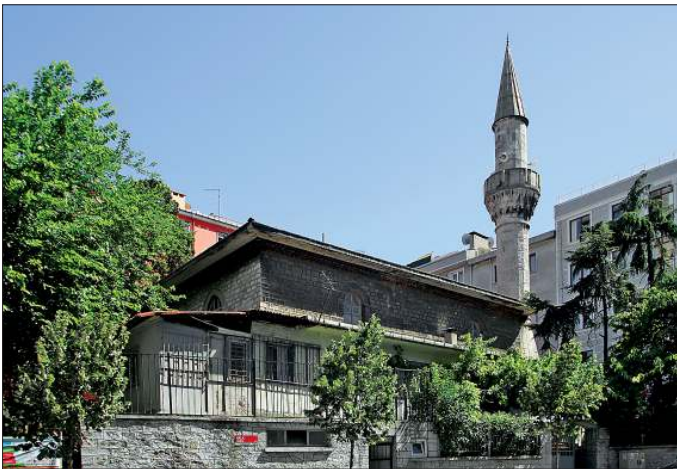
Sarı Süleyman Paşa'nın Üsküdar'da yaptırıldığı cami

Bosna-Hersek kökenli olup Hersek'in Prebol kazasına bağlı Hisarcık (Mileševo) kasabasında doğdu (Akün, XIX [1980], s. 17). Babasının adı Mürüvvet'tir. Öldüğünde altmış yaşını geçmiş olduğuna göre 1038 (1628-29) yılı civarında doğduğu söylenebilir. XVII. yüzyılın ortalarında saraya alındı, bir süre buradaki Helvacıyan-ı Hâssa Ocağı'nda hizmet etti. O sırada padişah musâhiblerinden dilsiz Tavşan İbrâhîm Ağâ'nın dikkatini çekti ve bir süre ona kethüdâlık yaptı. 3 Rebülâhir 1080'de (31 Ağustos 1669) divan çavuşlarının başına getirildi. Bu görevde iken Lehistan'la 18 Ekim 1672'de imzalanan Bucaş Antlaşması'nın akdinde hazır bulundu. 20 Zilkade 1083'te (9 Mart 1673) Sadrazam Köprülüzâde Fâzıl Ahmed Paşa tarafından sadâret kethüdâlığına tayin edildi ve onun vefatına kadar bu görevde kaldı. Görevi sırasında