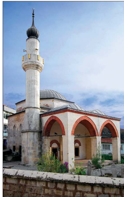
Edirne'de Şehâbeddin Paşa Camii

Varna zaferinden sonra nüfuzu hayli artan Şehâbeddin Paşa, Halil Paşa ile olan rekabetine hız verdi. 1445'te bir süre Sofya'da kalarak Hunyadi'nin faaliyetlerini takip etti. Bu arada Rumeli'nin uç beyleri üzerindeki etkisi de çoğaldı ve yeniçerilere