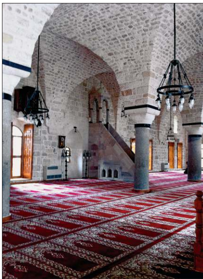
Antakya Ulucamii'nin harim kısmından bir görünüşü